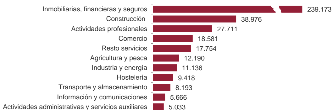
Capital suscrito de sociedades mercantiles creadas según su actividad económica principal (miles de euros). Mayo 2018

Por su parte, Actividades administrativas y servicios auxiliares presenta el capital menor, con 5,03 millones.