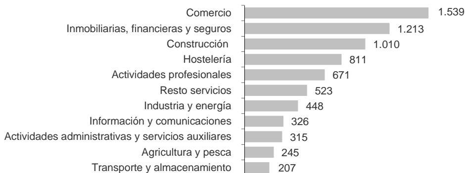
Saldo neto de sociedades mercantiles creadas según su actividad económica principal. Mayo 2018

La actividad con mayor capital suscrito de sociedades mercantiles creadas es Inmobiliarias, financieras y seguros , con 239,17 millones de euros.