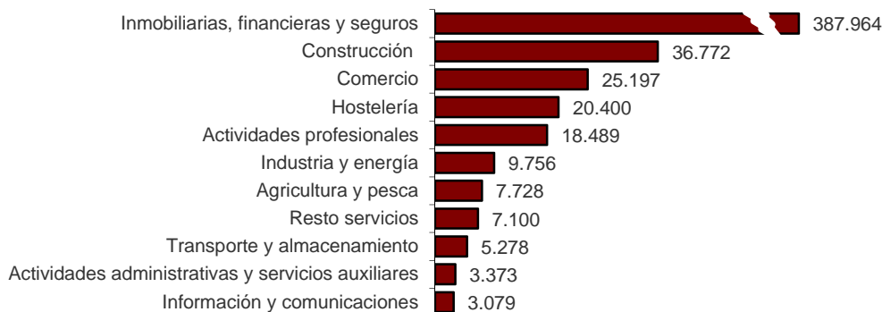
Capital suscrito de sociedades mercantiles creadas según su actividad económica principal (miles de euros). Junio 2017

Por su parte, Información y comunicaciones presenta el capital menor, con 3,08 millones.