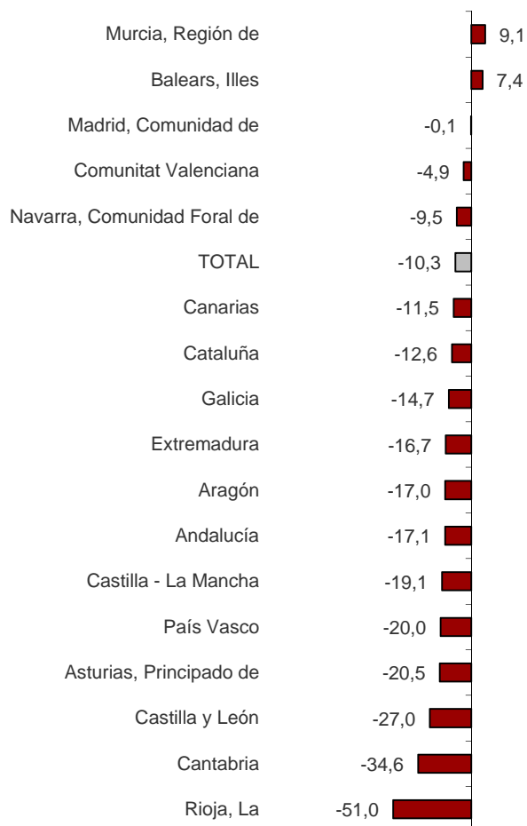
Variación anual del número de sociedades mercantiles creadas por comunidades autónomas. Junio 2017