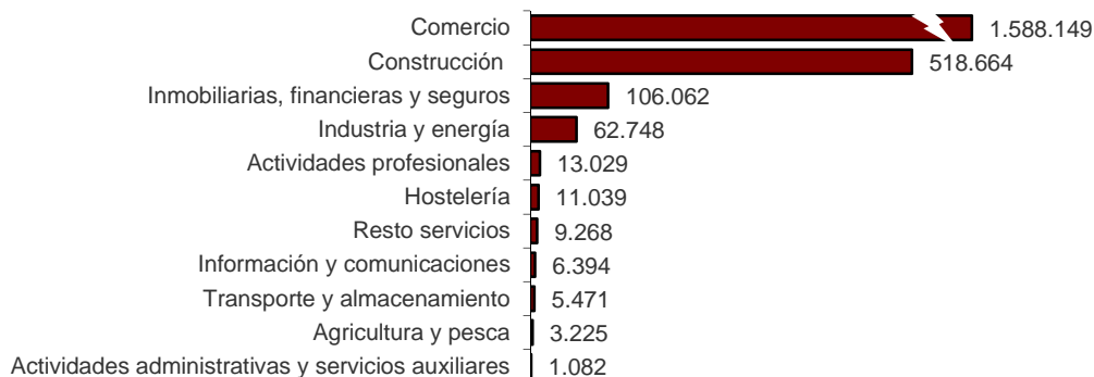
Capital suscrito de sociedades mercantiles creadas según su actividad económica principal (miles de euros). Noviembre 2015

Por su parte, Actividades administrativas y servicios auxiliares presenta el capital menor, con 1,08 millones.