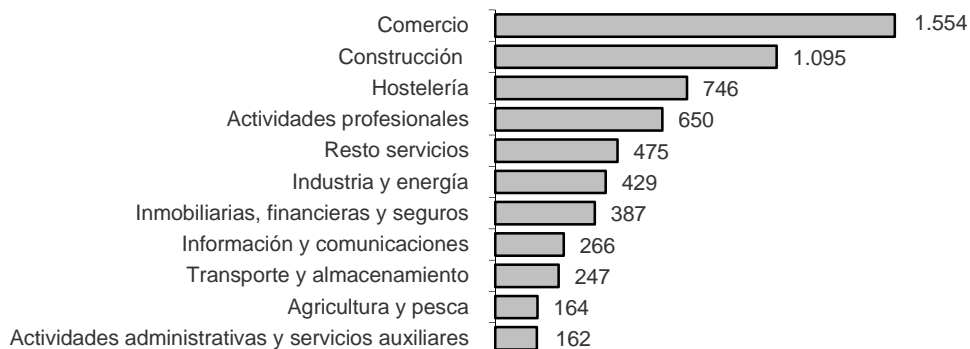
Saldo neto de sociedades mercantiles creadas según su actividad económica principal. Noviembre 2015

La actividad con mayor capital suscrito de sociedades mercantiles creadas es Comercio , con 1.588,15 millones de euros.