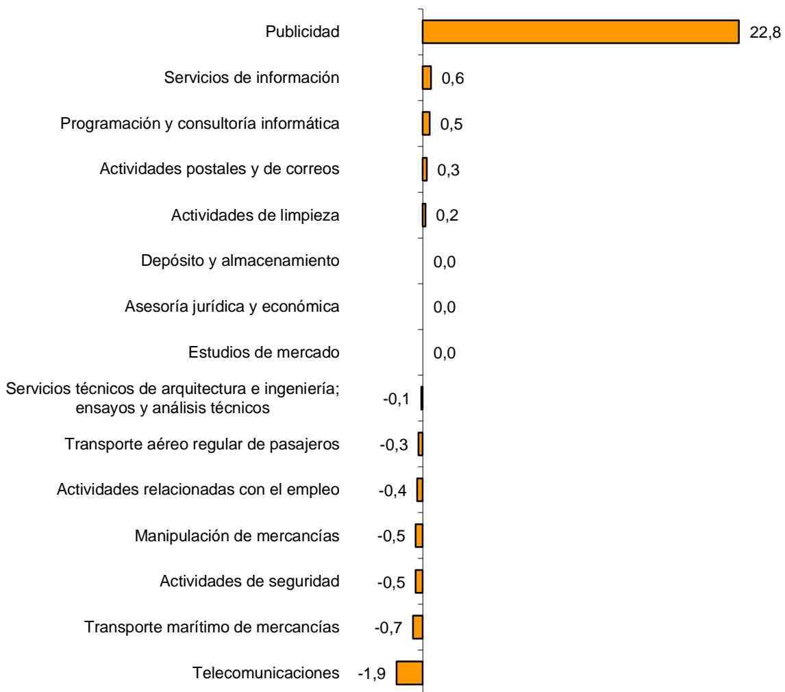
Tasas trimestrales del IPS, base 2010 Índice por sectores

Por su parte, entre las actividades cuyos precios han disminuido este trimestre respecto al tercer trimestre de 2015, destacan las Telecomunicaciones (-1,9%) y el Transporte marítimo de mercancías (-0,7%).