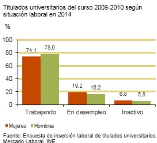
Tabla 3.8.2 Tasas de actividad, empleo y paro en 2014 de los titulados universitarios del curso 2009-2010