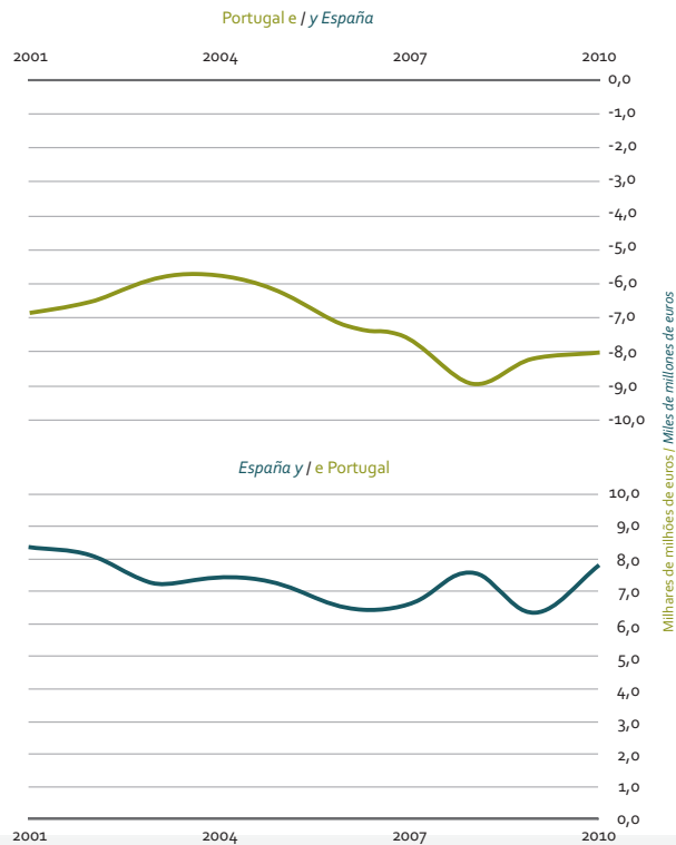
78 Saldo da balança comercial / Saldo de la balanza comercial