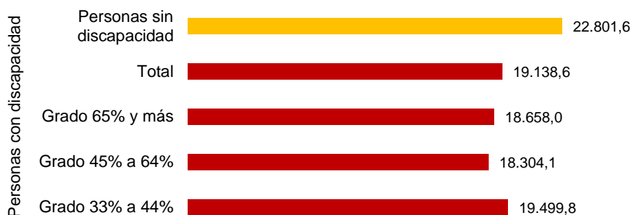
Salario anual según grado de discapacidad (euros). Año 2013.

La relación entre el nivel salarial y el grado de discapacidad no es lineal, en buena parte debido a la acción de las entidades especializadas en el apoyo a los colectivos de mayor grado de discapacidad.