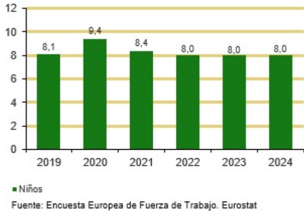
Tabla 1.10.2 Hombres y mujeres que viven en hogares con muy baja intensidad laboral según grupos de edad. Serie 2009-2024

Niños (de 0 a 17 años) que viven en hogares sin personas ocupadas (% del mismo grupo de edad y sexo)