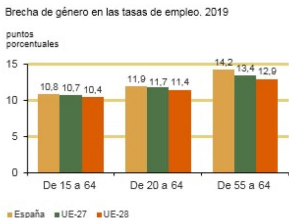
Tabla 1.1.4 Brecha de género en las tasas de empleo según grupos de edad y periodo. España, UE-27 y UE-28

Nota: UE-27: 27 países (desde 2020). UE-28: 28 países (2013-2020)