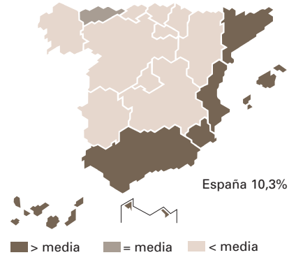
Tasas por 1.000 hab. de 18 y más años