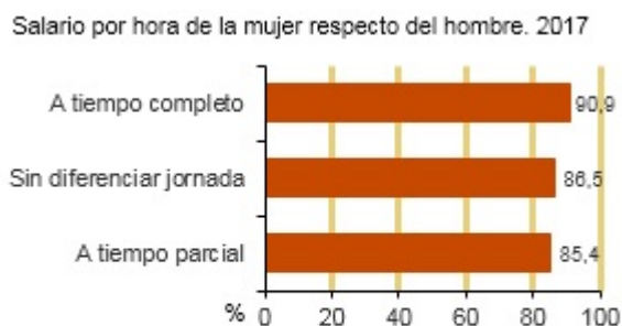
Tabla 2.1.2 Salario por hora por tipo de jornada y periodo