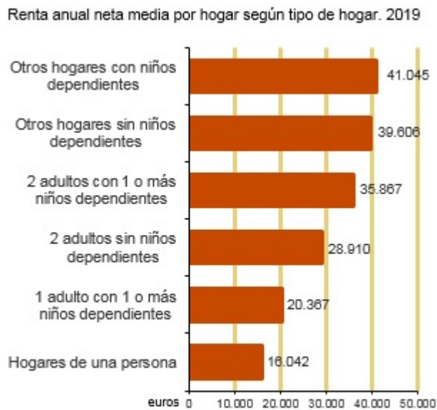
Tabla 2.5.3 Renta anual neta media por hogar, persona y unidad de consumo por tipo de hogar