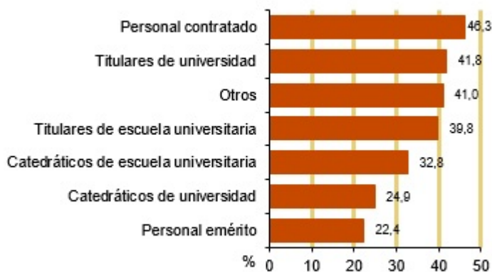
Mujeres en el profesorado de educación universitaria. Curso 2019-2020

Fuente: Las cifras de la educación en España. Indicadores y publicaciones de síntesis. Ministerio de Educación y Formación Profesional