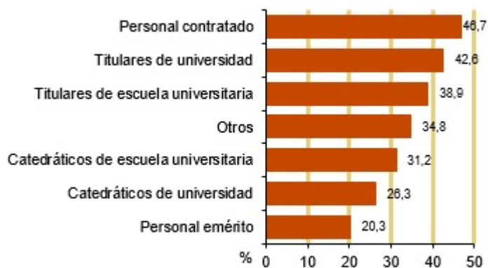
Mujeres en el profesorado de educación universitaria. Curso 2021-2022

Fuente: Las cifras de la educación en España. Indicadores y publicaciones de síntesis. Ministerio de Educación, Formación Profesional y Deportes