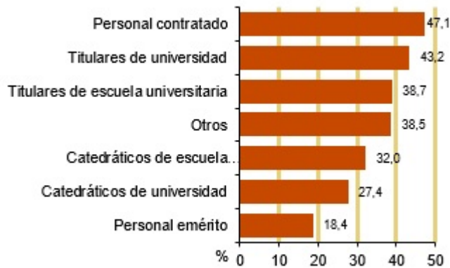
Mujeres en el profesorado de educación universitaria. Curso 2022-2023

Fuente: Las cifras de la educación en España. Indicadores y publicaciones de síntesis. Ministerio de Educación, Formación Profesional y Deportes