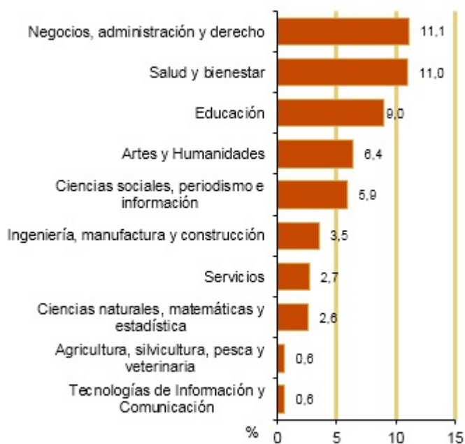
Mujeres graduadas en educación superior. España. 2018