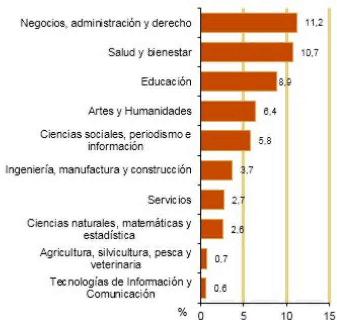
Mujeres graduadas en educación superior. España. 2017