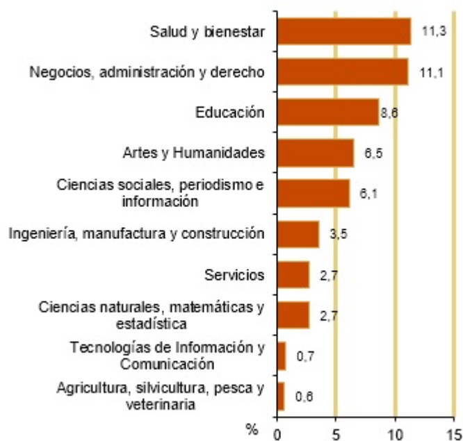
Mujeres graduadas en educación superior. España. 2019