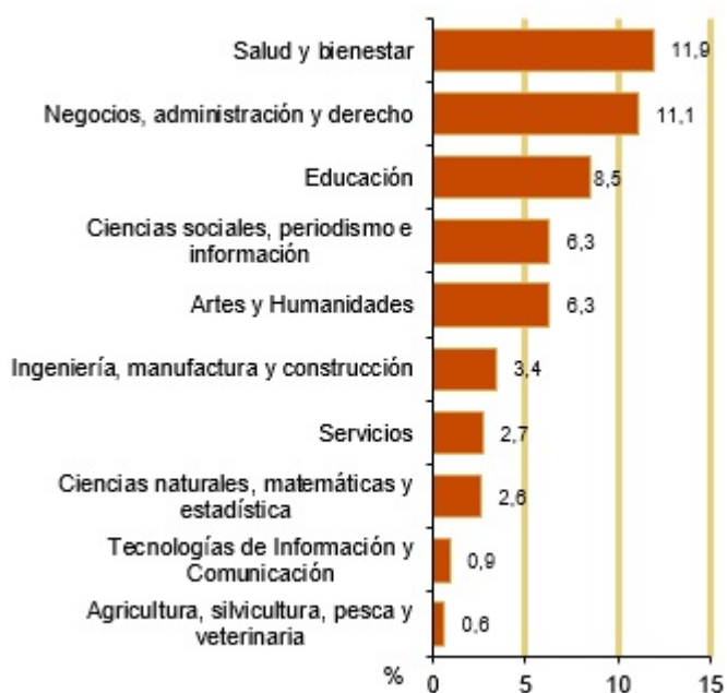
Mujeres graduadas en educación superior. España. 2021