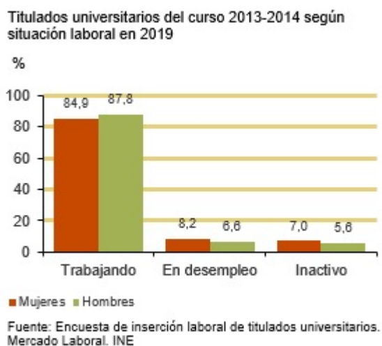
Tabla 3.8.2 Tasas de actividad, empleo y paro de los titulados universitarios