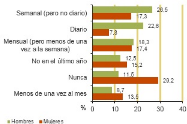
Frecuencia de consumo de bebidas alcohólicas. 2017