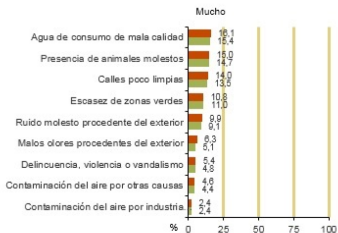
Problemas medioambientales en la vivienda. 2017