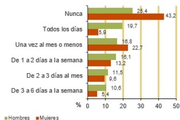
Frecuencia de consumo de bebidas alcohólicas. 2020