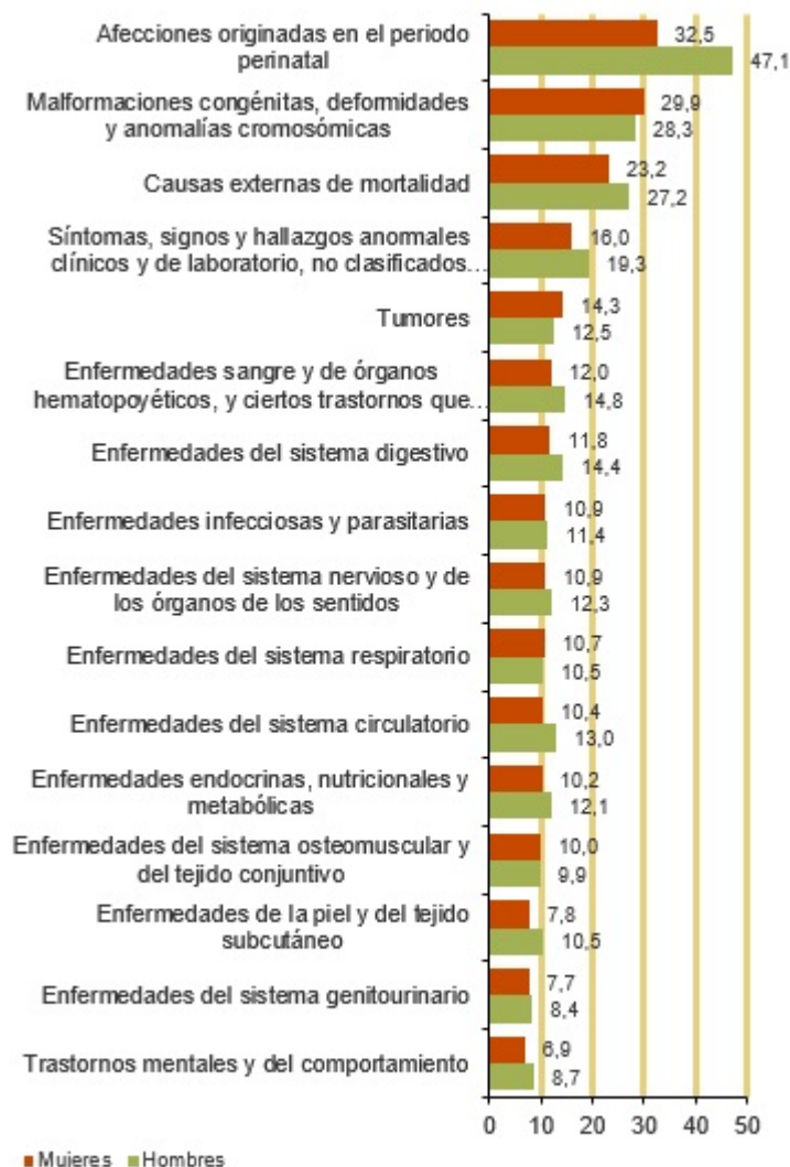
Número medio de años potenciales de vida perdidos. 2022