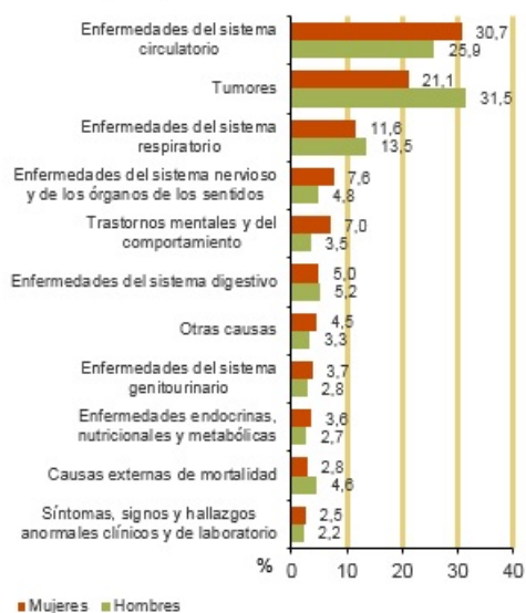
Defunciones según causas de muerte más frecuentes. Año 2018 (% total)