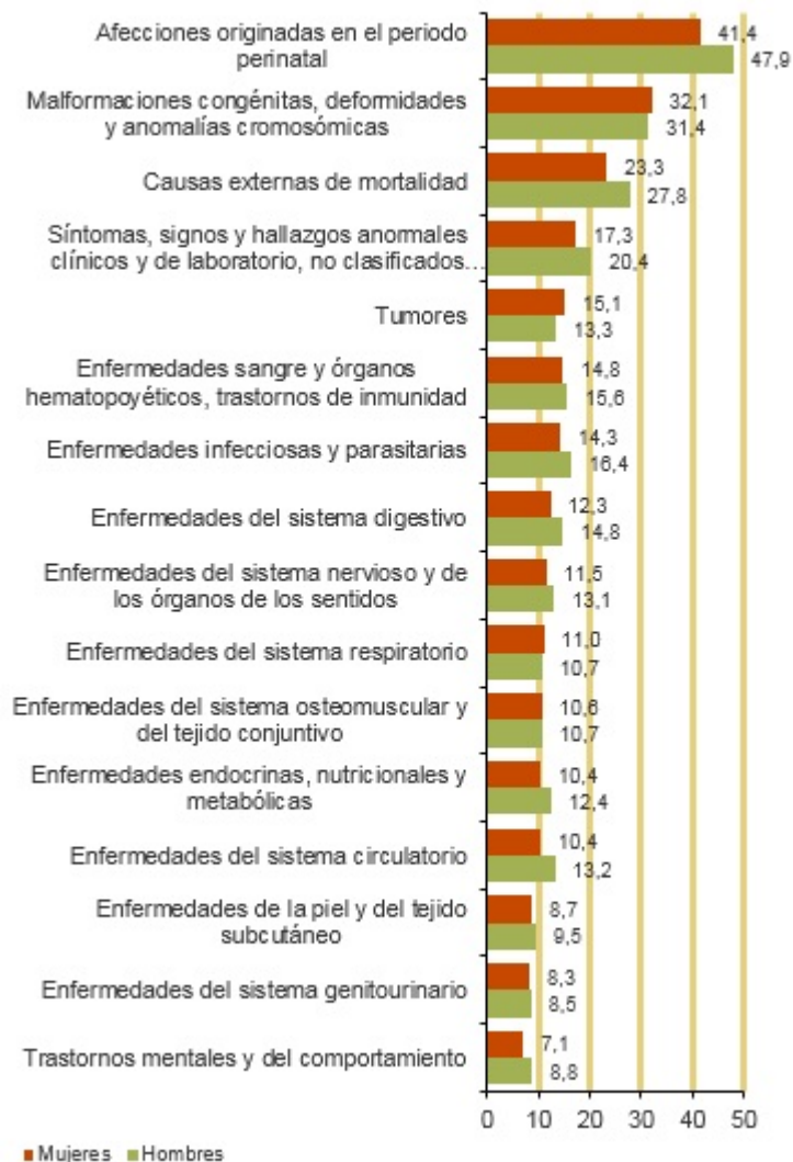
Número medio de años potenciales de vida perdidos. 2018