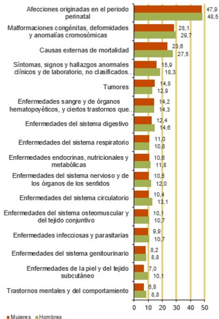
Número medio de años potenciales de vida perdidos. 2020