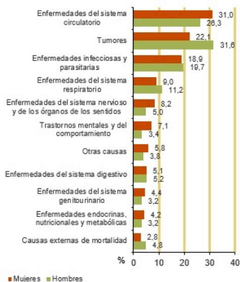
Defunciones según causas de muerte más frecuentes. Año 2020 (% total)