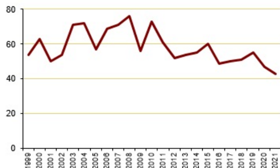
Número de víctimas mortales por violencia de género. 1999-2021

Nota: se incluyen aquellos casos en los que el agresor es el cónyuge, excónyuge, compañero sentimental, excompañero sentimental, novio o exnovio.