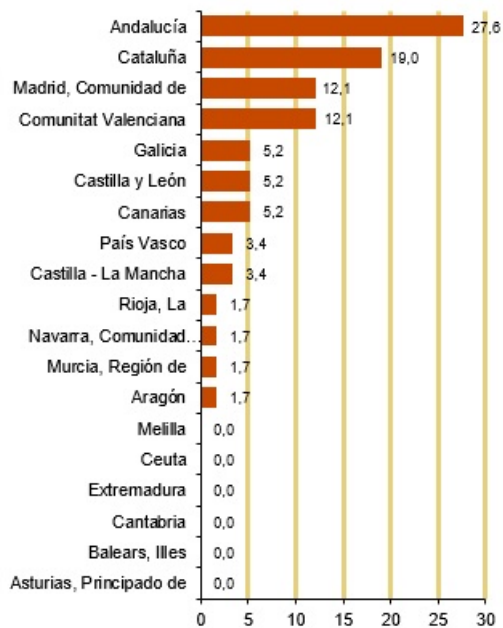
Víctimas mortales por violencia de género según comunidad autónoma. 2023 (%)