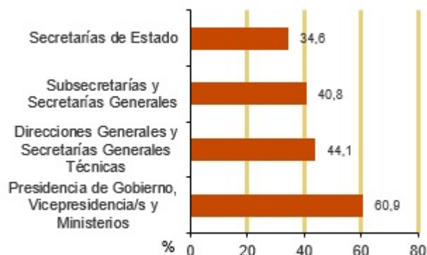
Mujeres en órganos superiores y altos cargos de la Administración General del Estado. 2021 (%)